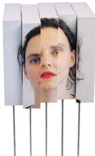
Auf bewegliche Holzblöcke montiert, erwacht die starre Fotografie zu bizarrem Leben.