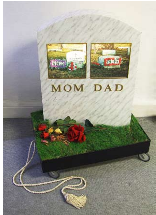
Spart lästige Friedhofsbesuche: Der fahrbare persönliche Grabstein.